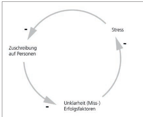
Abbildung 1: Stressloop (eigene Darstellung).